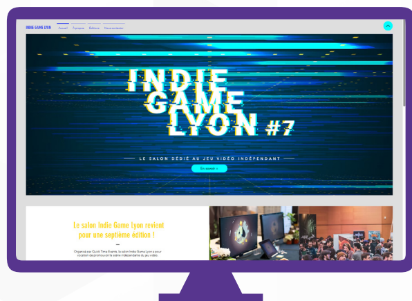
Site web. + Réseaux sociaux.