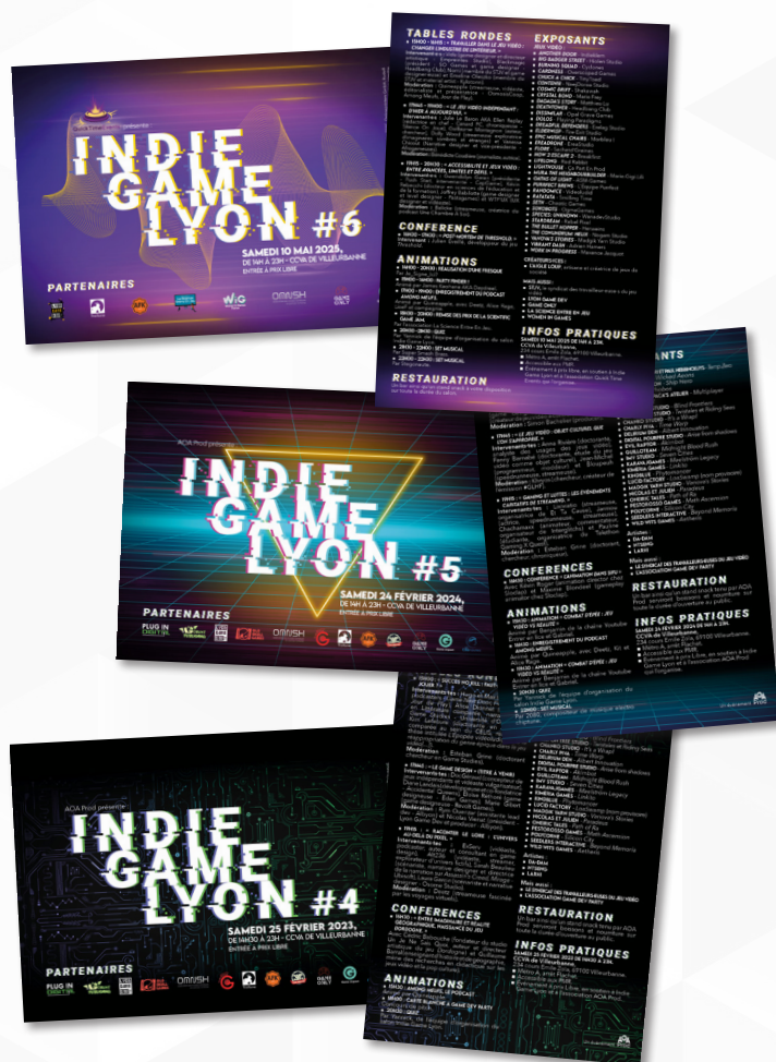
Flyers avec le détail des programmations.