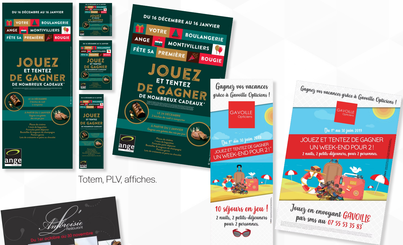
Totem, PLV, affiches.