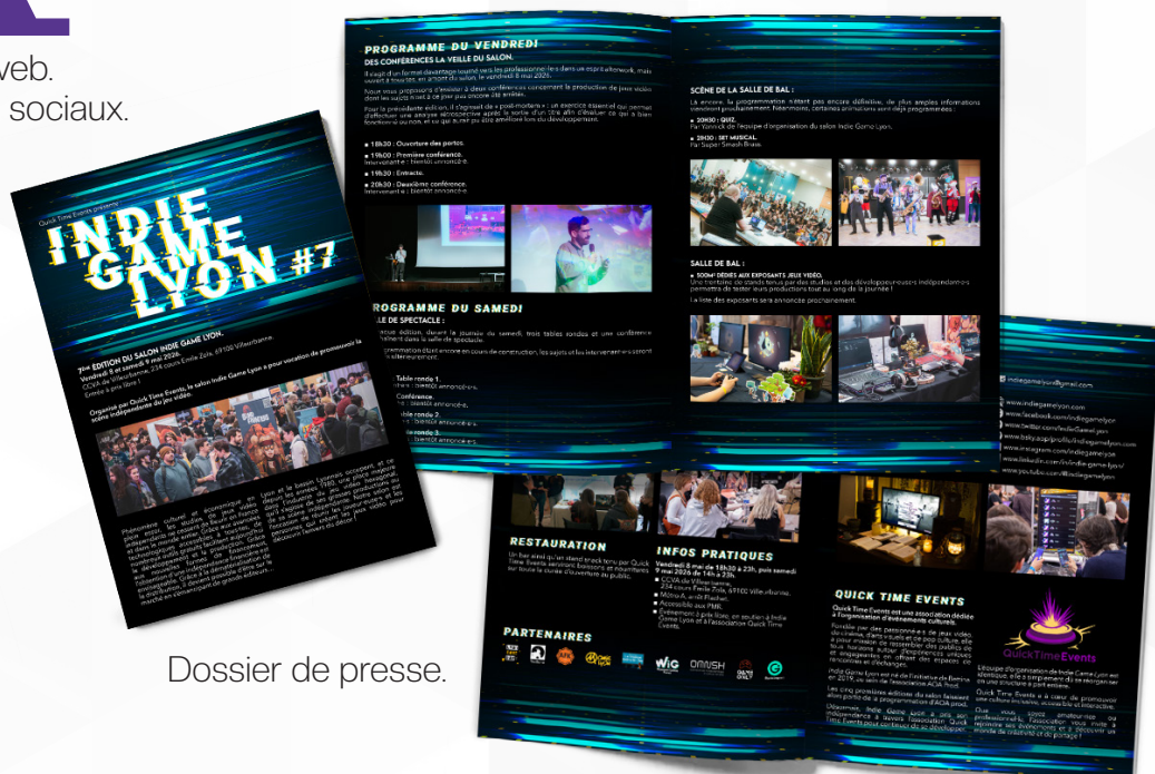
Dossier de presse.