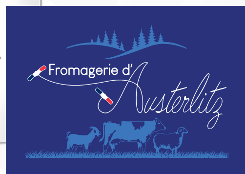
Logo et éléments iconographiques.

+ Divers supports prints (étiquettes, emballages, sacs, etc.)