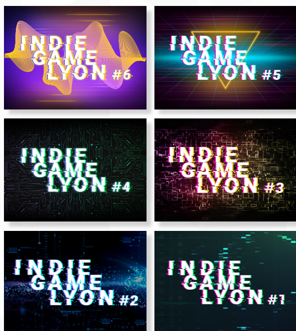
Logo et identités graphiques de chaque édition du salon.

Voici les travaux réalisés pour les projets événementiels que je pilote et dont je gère toute la communication : Création des identités visuelles et de toutes leurs déclinaisons ; création des supports prints et numériques ; gestion des réseaux sociaux ; création et mise à jour des sites web ; tournage et montage de vidéos ; etc.